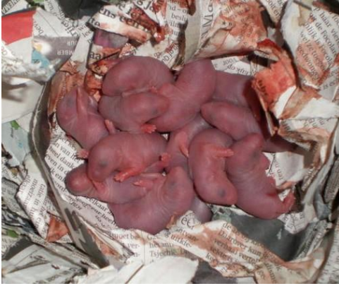
Ratjes 1 dag oud