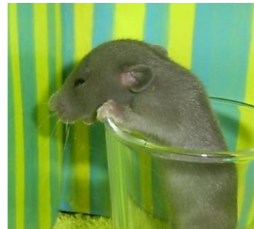
Ratje 16 dagen oud