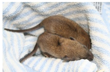
Handdoekje als nest

Jonge ratten vanaf 21 dagen oud kunnen het beste worden gehuisvest in een kleine kapkooi of Duna (50 x 35 cm) met een laag keukenpapier. De bak wordt voor de helft geplaatst op een regelbare warmtemat, de temperatuur mag nu rond de 17 tot 20 graden zijn. Een klein handdoekje op de warme kant vormt een lekker nest.