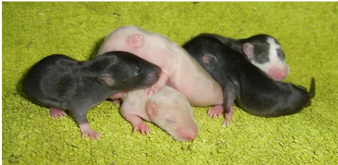
Ratjes 12 dagen oud