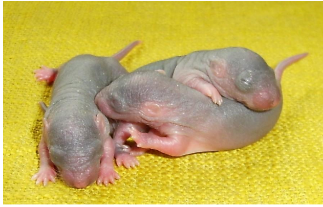
Ratjes 4 dagen oud